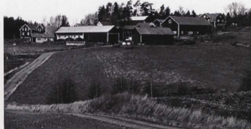
Mickelsdal i Ringarums socken, 1982.