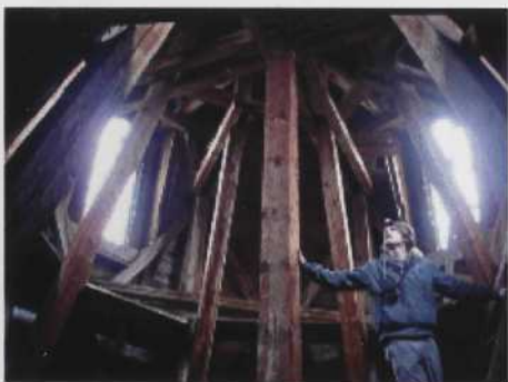
Uppe i kyrkotornet i Hannäs på jakt efter handlingar. Lägg märke till en viktig detalj i inventerarens utrustning: pannlampan.