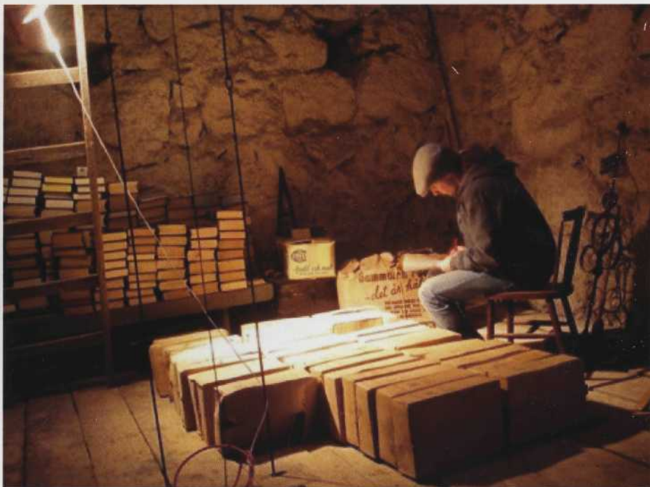
ÖLFA:s inventerare av sockenkistor, kyrkotorn och kyrkvindar i full färd med att inventera kyrktornet i Tryserum, där hela Kristidsnämndens arkiv från andra världskriget förvarades.