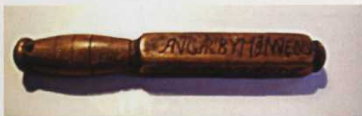
Budkavle i Axstad by, Högby socken