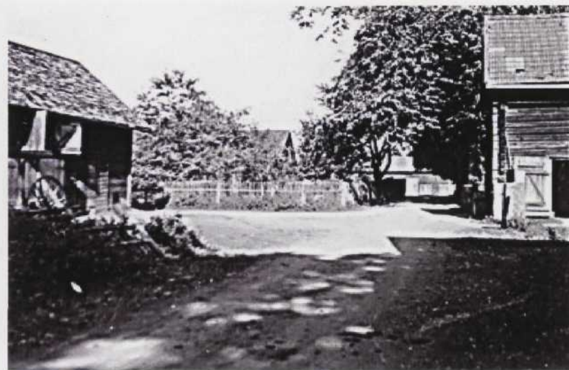
Bygata i Kärnskogen, Godegårds socken, 1936.

Inventerad den 12 juni 2007 av Bertil Gustafsson.